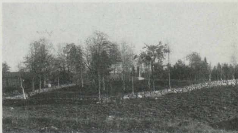
Fig. 1. Kyrkplatsen. The church place.