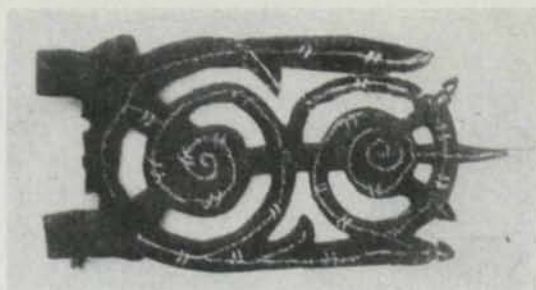
Fig. 3. Flöjel av järn. Weathercock of iron.