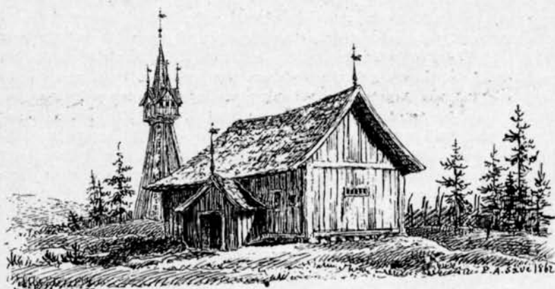
Fig. 5. Stavkyrkan i Skagen efter P. A. Säve. Stave church at Skagen. After P. A. Säve.

säger: »Till Skagas kapell i Udenäs Gäll insändas ännu från åtskilliga orter ansefliga offer för att hjälpa ur nöd, vilken vidskepelse härleder sig från påvetiden, då ett Döparens huvud av trä troddes därstädes hava en undergörande kraft.» När nämnda arbete 1835 trycktes, fanns ej längre något kapell i Skagen att offra i.