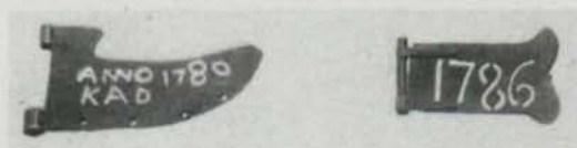
Fig. 4. 2. st. flöjlar. Obs! Flöjeln t. v. bär märken efter »löv». 2 weathercocks. Obs! The weathercock to the left carries marks from »leaves».

och Halna kyrkor. Att Peringskiöld icke skulle ha känt till den gamla stavkyrkan i Undens strandbygd är uteslutet. Antingen har en teckning av den funnits men avlägsnats — härom finnes från initierat håll uttalande — eller ock visar övre bilden å omskrivna plansch icke Undenäs gamla spånbeklädda träkyrka, som åtminstone under senare år tedde sig annorlunda, utan i stället stavkyrkan i Skagen uti Undenäs socken.