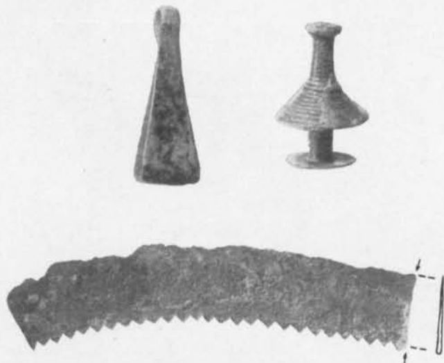
Fig. 2. Pincett, dubbelknapp och såg (?) från kistan. (SHM 24964.) 1/1. — Pincette, double button and saw (?) from the stone cist.

Förutom benen påträffades inom kistan en dubbelknapp , en pincett och en såg (?), allt av brons (fig 2). Dubbelknappen har en med en liten skiva avslutad stång. Hela knappen är ornerad med små, runtom gående vulster, av vilka två, den i övergången mellan brätte och stång samt nummer två från brättets kant räknat, äro utformade som repstavar. Knappen hör närmast hemma i 3:e periodens föremålsbestånd. Pincetten är oornerad. Den har sina närmaste motsvarigheter i början av 4:e perioden. Sågbladet är svagt böjt och har en gammal brottyta i ena änden medan i den andra en ursprunglig, vinkelrät avslutning finnes bevarad. Tänderna, som äro ovanligt väl bibehållna, äro snedfilade som på en modärn såg med den skillnaden att på bronsbladet 6—7 tänder äro skränkta åt samma håll, de 6—7 följande tänderna åt motsatta hållet o. s. v. Om det är riktigt att tolka bladet som en såg, följer därav konstaterandet att man tydligen redan under bronsåldern har förstått att genom skränkning göra sågen effektivare. Den sågtandningen motsatta sidan har tydlig egg och bladet uppvisar obetydliga, långsgående nötningsspår.