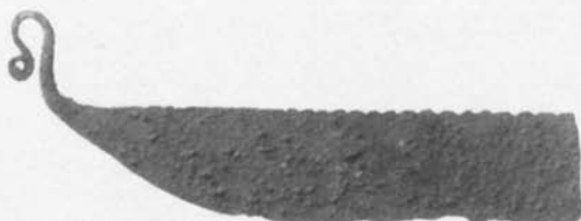
Fig. 3. Rakkniv med sågtandad rygg, bronsålder, per. 4. Danmark, utan närmare fynduppgift. (SHM 7571:178.) 1/1. — Razor with serrated back. Bronze Age, per. 4. Denmark, exact find locality unknown.

ena änden (avbruten på Resmo-sågen?). Blad och skaft, fästa vid varandra endast i en punkt, har dock knappast kunnat ge den styrka åt redskapet som krävts. Genom att låta kila in ryggsidans egg i en utmed bladets rygg gående förlängning av skaftet bör detta enklast ha kunnat uppnås. Av de danska sågarna är en funnen tillsammans med pincett och dubbelknapp liksom Resmo-sågen. 2