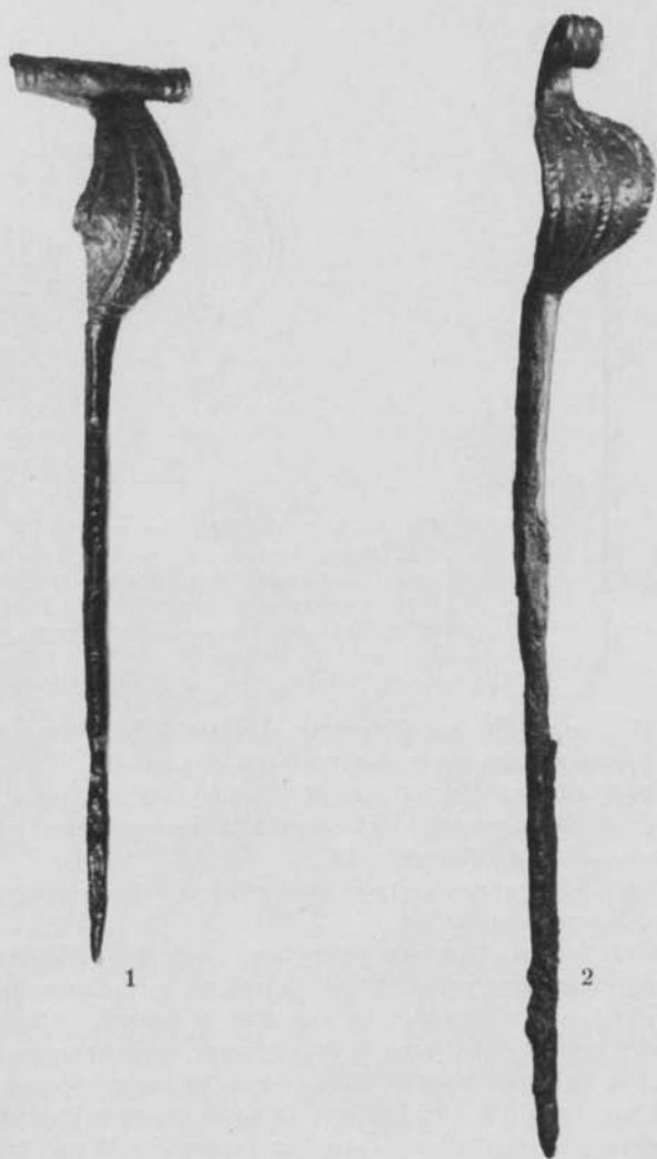
Fig. 1—2. 1. Nål från Chroberz, pow. Pińczów. 1/1. — Pin från Chroberz. 2. Nål från grav nr 3, Lekarehed, Lärbro sn, Gotland. 1/1. — Pin från grav nr 3, Lekarehed.