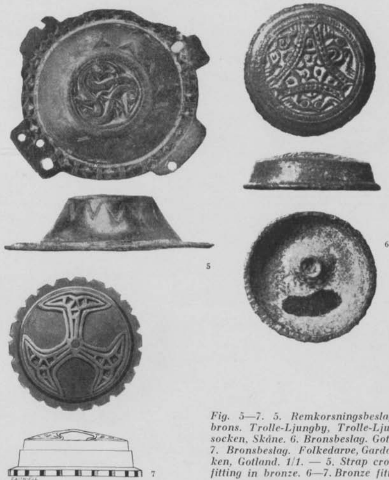
Fig. 5—7. 5. Remkorsningsbeslag av brons. Trolle-Ljungby, Trolle-Ljungby socken, Skåne. 6. Bronsbeslag. Gotland. 7. Bronsbeslag. Folkedarve, Garda socken, Gotland. 1/1. — 5. Strap crossing fitting in bronze. 6—7. Bronze fittings.

och inom de spetsovala fälten var sin cirkel eller dubbelcirkel med mittpunkt är välkänd på runda spännen ifrån mitt skede 2 av Vendeltiden, 1919 av mig daterat till ca 600—ca 675, nu med min femperiodsindelning till tiden ca 600—ca 650; jfr t. ex. spännet Gravfynden från Gotland under tiden 550—800 fig. 56.