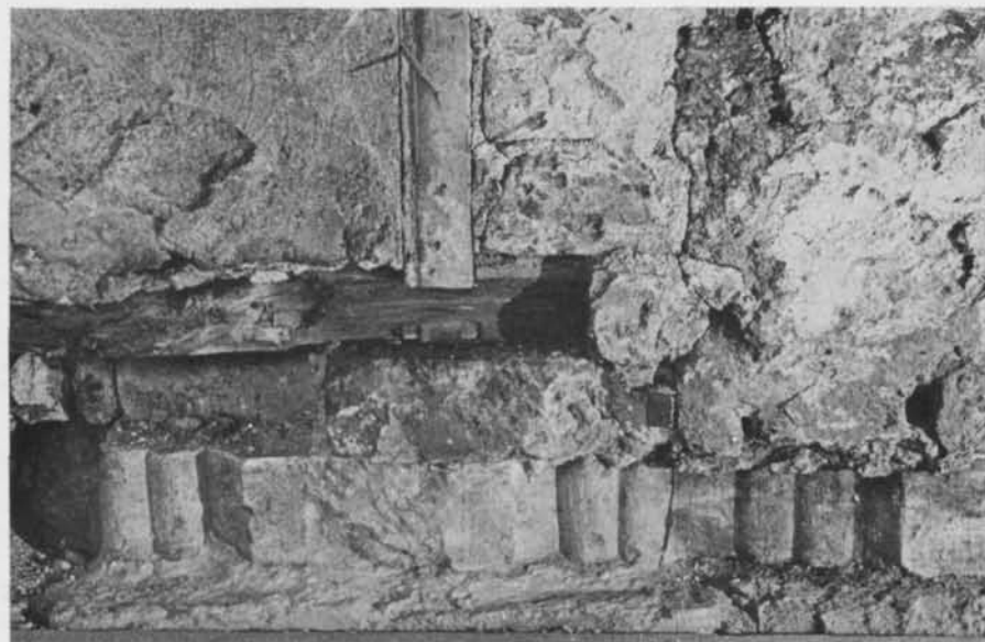
Bild 1. Den s.k. Medusastenen, som den upptäcktes i sitt sekundära läge. — The Medusastone, as it was found in its secondary situation.