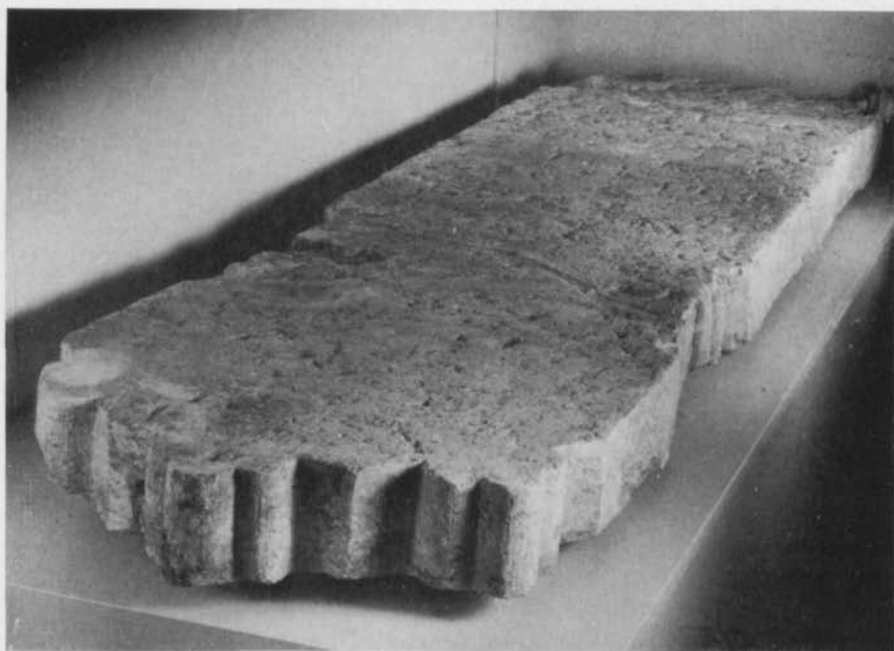
Bild 4. Stenfyndet i konserverat skick utställt på Stockholms Stadsmuseum. Materialet är gotländsk kalksten. Foto L. af Petersens 1971. — The find, shown in the Town Museum of Stockholm.