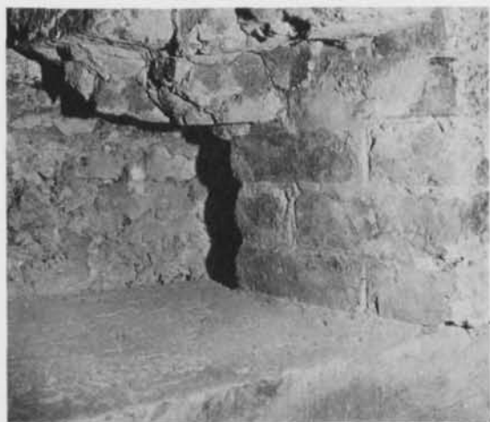
Bild 2. Bild från framtagningen. T. h. de fem bevarade skiften av smygen i den port, vari Medusastenen lagts som tröskel. Observera tegelmurverkets planstrukna fogar med bred rits. — Picture showing a stage of the exposure. To the right, five courses of the doorway in which the stone served as threshold. Observe the joints, flat-rubbed with broad scratches.

huggningen samt den därvid använda tekniken förde tanken till högklassig arkitektur från tidig gotik. Stenens övriga utformning fanns det emellertid på det här stadiet ingen möjlighet att uppskatta, till stor del beroende på att muren, som den låg i, inte är åtkomlig från baksidan. Ett önskvärt friläggande av hela stenen ansågs vara förenat med tekniska svårigheter och tycktes utsiktslöst, framför allt på grund av bristande ekonomiska resurser.