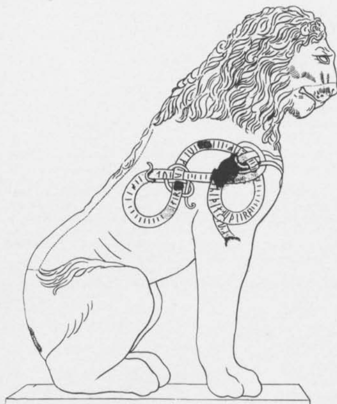
Fig. 2. Marmorlejonet från Pireus. Efter Akerblad (1800). — The marble lion from Pireus. After Akerblad.

av de första sex delarna som utgavs under åren 1314—18/1896—1900 har följts av en modernare upplaga av del 7—10, som dock icke kan anses helt tillfredsställande. Det har med all rätt framhävts av Babinger (1927) och av H. Turkova (1953) — denna senare har översatt avsnittet om Konstantinopels erövring av Mehmet II — samt av Walther Björkman (1964) och H. W. Duda (1965) (som svarar för de modernaste översikterna av Evliya Çelebis liv och verksamhet), att texten i många stycken är otillförlitlig och erbjuder stora svårigheter för en adekvat översättning. Evliya Çelebi är ofta ganska fantasifull och i en del fall är det knappast troligt, att han själv besökt de länder som han beskriver. Det gäller inte minst om hans beskrivning av de nordeuropeiska länderna, däribland Sverige, som kallas för