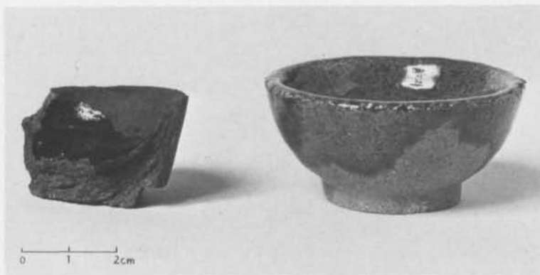
Fig. 3. En 1600-talsdegel (den vänstra) och en modern d:o, s. k. skärvel, som används vid kemisk analys av ädelmetaller. — A 17th century crucible (to the left) and a modern one, used in chemical analysis of noble metals.

så det slutgiltiga beviset på att även formen hos två av 1600-talsdeglarna kan kopplas till proberingskonsten. Det är det kvalificerade hantverk, som har med ädelmetallhantering att göra.