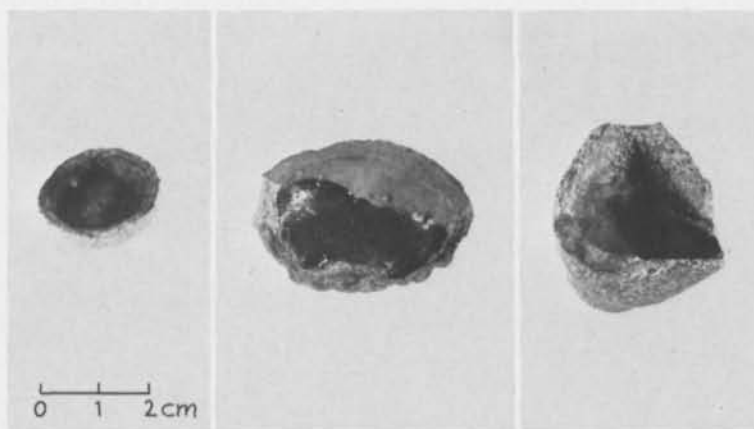
Fig. 1. Tre deglar påträffade på Helgeandsholmen i Stockholm. (Fyndnummer från vänster: 1921, 2695 och 960.) — Three crucibles, found at Helgeandsholmen in Stockholm.