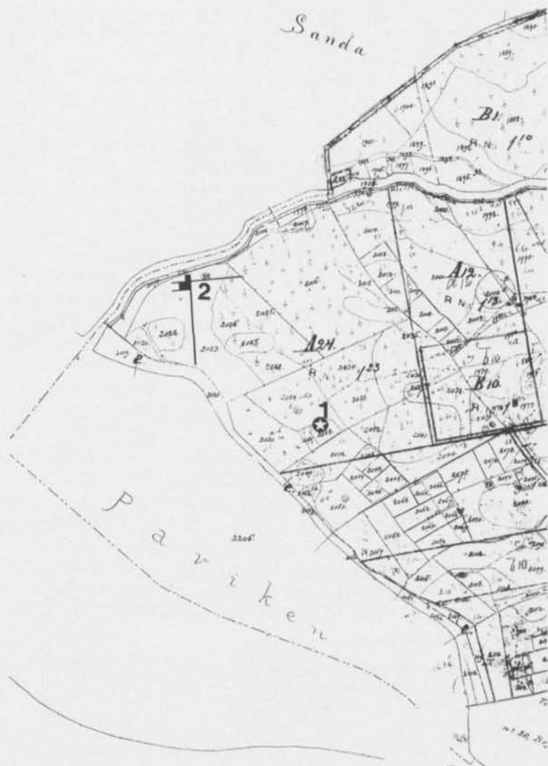
Fig. 2. Utsnitt av 1876 års laga skifteskarta för Stora och Lilla Mafriids. På kartan har förutom den sannolika fyndplatsen för ringnålen (1) även markerats var 1967—1973 års undersökningar ägde rum (2). Kartreproduktionen gjord av Överlantmätarmyndigheten i Gotlands län och bekostad av Berit Wallenbergs stiftelse. — Parcelmap of 1876 showing the probable finding place of the pin-brooch (1), also indicated is the area of the 1967—1973 excavations (2).

frids framgår att flera små åkerparceller tagits upp i Strandhagen. Westerlunds parcell som väl måste vara identisk med fyndplatsen för ringsöljan markeras på kartan med nr 2032. På kartavdraget, fig. 2, har såväl denna plats om Sjöhistoriska museets utgrävningsyta markerats. Liksom den senare var när utgrävningarna påbörjades så är platsen för Westerlunds åker i dag belägen i en helt