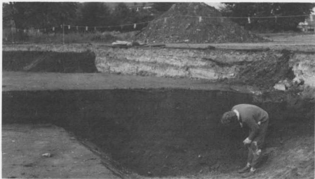
Fig. 2. Undersökningen 1989 av den vikingatida ringborgen i centrala Trelleborg. Skärning genom den ca 4 m breda och 1,5 m djupa vallgraven utanför ringborgens nordvästra del.

Borgens yttre ramar är således tämligen säkert fastställda. Svårare är det att ur gytret av lämningar inne på borgområdet få klarhet i hur bebyggelsen gestaltat sig – om det nu funnits någon bebyggelse i borgen. Här förekommer nämligen rikligt med lämningar från skilda tider. Spridda spår av en neolitisk bopättning blandas med gravar och boplatslämningar från yngre bronsålder, boplatslämningar från vendeltid och äldre vikingatid samt hus, brunnar m. m. från den medeltida stadsbebyggelsen.