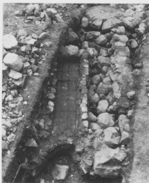
Fig. 2. 1991 års provschakt i borgkullen intill Vårfruberga kloster, Södermanland. Bilden är tagen mot väster och till vänster i schaktet syns den smala gången med sitt tegelgolv. Till höger därom liksom i bakgrunden syns resterna av trappornets kraftiga murverk. Schaktbredden är 2 meter.

vecklingen av borgen vid Kungsberg bör ha fått konsekvenser även för samtiden. En förvaltningsborg kan knappast läggas ner, utan att dess funktioner läggs över till något annat administrativt centrum. Försvinner detta nordliga förvaltningsområde genom att uppgå i t. ex. Nyköpingsfögderiet, eller bibehålls det med nytt centrum på annat håll inom området?