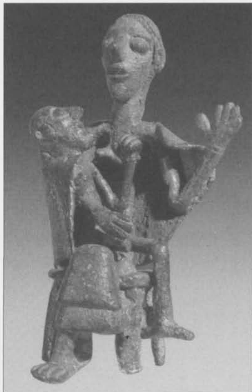
Fig. 4. Gudinna sittande på en pall, 10 cm hög. Efter Lilliu 1966, s. 64. — Goddess seated on stool, 10 cm high.

Bronsålderns religion, symboler och kosmologi spred sig över Europa från Mellersta Östern (Kristiansen 1998, Larsson 1997). Strömningarna togs emot och förvaltades på olika sätt i olika delar av Europa. I publikationen över Balkåkra- och Hasfalvafyndet nämner Anita Knappe det i Italien påträffade föremålet men utan kommentarer eller avbildning (Knappe & Nordström 1994, s. 55). Som jag angivit ovan är enligt min egen uppfattning likheterna mellan de sardiska föremålen och de båda välkända kultföremålen från Balkåkra och Hasfalva (fig. 1) så påtagliga att en gemensam föreställningsvärld måste föreligga. Jag menar alltså, att bakom alla de omnämnda föremålen finns kunskap om ett fenomen som i stiliserat skick får just den här detaljerade utformningen med de tämligen exakta inbördes proportioner som föreligger i samtliga fall. Den praktiska applikationen och användningen kan givetvis ha skiftat mellan de stora trumliknande föremålen och de miniatyrföremål från Sardinien som av allt att döma varit placerade på ett standar eller liknande. Det väsentliga är dock den symbolfunktion som av allt att döma varit spridd över mycket stora delar av Europa.