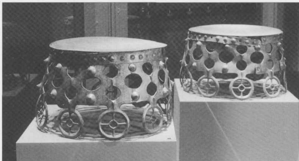
Fig. 1. Kultföremålen från Balkåkra och Hasfalva, båda ungefär 27,5 cm höga och 41,5 cm i diameter. Efter Larsson 1997, s. 67. – The cult objects from Balkåkra and Hasfalva, both c 27.5 cm high and 41.5 cm in diameter.

Under år 2000 studerade och jämförde jag formspråket i de sardiska bronserna och de svenska hållristningarna från sen bronsålder och tidig järnålder. Arbetet ingick i en seminarieuppsats vid Högskolan i Kalmar. Ämnesvalet hade sin grund i ett intresse för Sardiniens förhistoria och för likheterna mellan å ena sidan plastiskt utformade metallföremål från Medelhavsområdet och å den andra tvådimensionella hållbilder från Skandinavien.