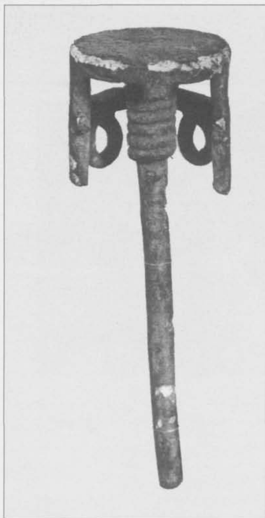
Fig. 2. Symbolisk pall nr. 262. Arkeologiska museet i Sassari på Sardinien. Efter Lilliu 1966. — Symbolic stool no. 262. Archaeological Museum of Sassari, Sardinia.

vid boplatser, som depåfynd och som lösfynd. Hittills har det varit svårt att tidsbestämma dem, men ett dussintal bronser är funna i etruskiska gravar på fastlandet och ger därmed en datering till sen bronsålder och tidig järnålder, d.v.s. 700–500 f.Kr. (Webster 1996, s. 198).