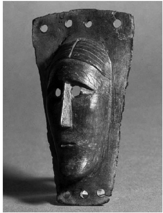
Fig. 5. Bronsmask från Gårdby i Gårdby socken, Öland. Trolig datering förromersk järnålder. inv. nr 14198. —Bronze mask from Gårdby, Gårdby parish, Öland. Probably from the last few centuries BC.

En annan möjlighet är att Vångmasken varit fastsatt på en vagn av trä och utgjort utsmyckning på denna. Den skulle då ha fyllt en liknande funktion som bronsmaskerna på Dejbjergvagnen. Vagnen i fråga skulle kunna ha brukats i profana men mer sannolikt sakrala sammanhang. Ytterligare en möjlighet är att ansiktsbilden från Blekinge varit fastsatt på ett hus, eventuellt ett kulthus, så som fallet ofta var i keltiska trakter. Läsaren erinras om templen i Entremont och Roquepertuse, vilka bägge var utsmyckade med människohuvuden. Vångmaskens serena drag talar i så fall för att den snarare haft en beskyddande än en avskräckande funktion. En fjärde möjlighet är att maskbilden varit fästad vid en statyett av trä. Hypotesen får stöd av fynd av ansiktsmasker från Gallien och Britannien som varit fastsatta på underlag av trä, eventuellt kultstatyetter (Ross 1996, s. 132 f). Tänk-