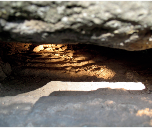
Fig. 1. Palmettblad på stenens övre hörn. Foto förf. —Palmetto leaf visible on the upper corner of a lily slab in the tower wall of Lindärva church.

köping om liljestenarnas skyddsbehov, deras ikonografi och deras bakgrund. Skara.